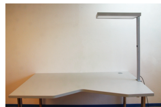
Maximale Tischstärke 40mm